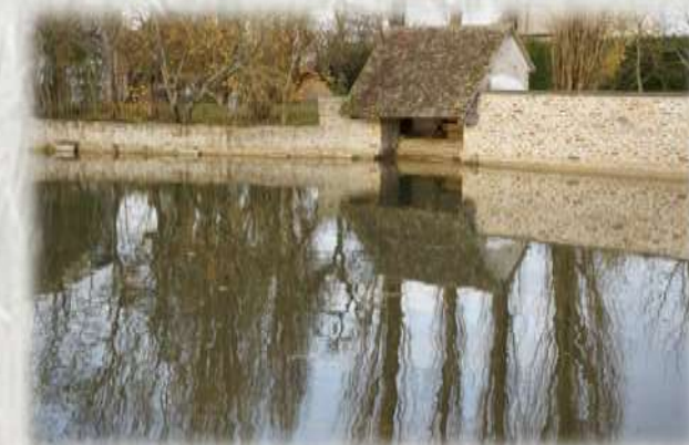
La Chapelle-Rablais – Photo CCBN ©

La commune de La Chapelle-Rablais se situe dans un écrin de verdure. Le village est une clairière au milieu des bois dont une grande partie est domaniale, donc accessible à tous pour profiter de la nature.