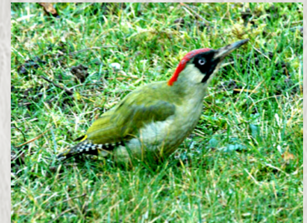
Pic - Photo LPO -IDF ©

Depuis la base de loisirs de Buthiers (à découvrir !) parcourez les paysages du Gâtinais français. Le long de la haute vallée de l'Essonne, chaos gréseux et forêts découpent l'horizon.