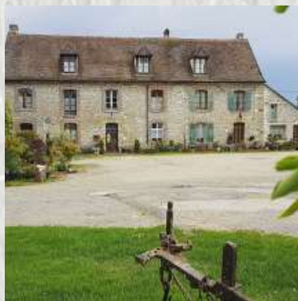
Échou : Ferme de la Recette

A Échou, la ferme de la Recette possède un ancien colombier au toit à pans coupés. Au Moyen Age, les moines y engrangeaient leur récolte bien avant qu'elle ne deviennent une ferme-auberge. Le bois d'Échou recèle deux chênes remarquables près du carrefour du Pavé-de-Boulains. La faune (faisans, lapins de garenne, sangliers, cerfs et biches) et la flore, protégées y sont diversifiées. Le gouffre de La Sablière à l'est du bois fait partie des curiosités naturelles.