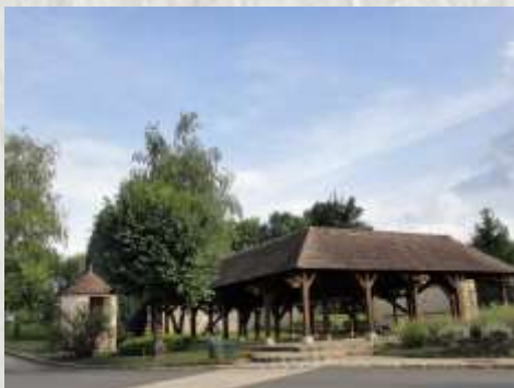
Valence-en-Brie : lavoir