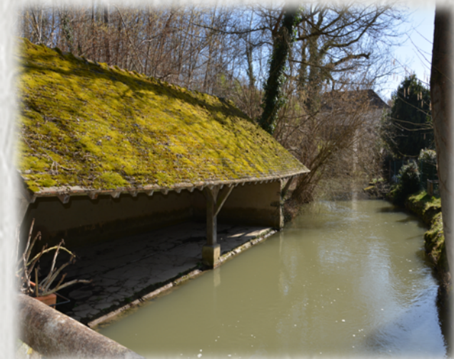
Le Lunain à Nanteau

Aux portes de Fontainebleau, entrez dans le tunnel de verdure de la forêt de Nanteau, à la découverte de pierres granitiques singulières, sujets de légendes et de coutume celtiques.