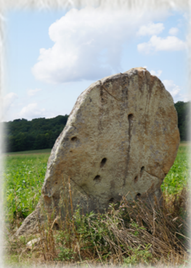
La roche aux aiguilles

On raconte qu'autrefois, les jeunes filles venaient jeter des épingles dans les trous de la roche en s'arrangeant pour qu'elles ne tombent pas, signe de mariage dans l'année. Coutume païenne qui se retrouve dans de nombreuses forêts ou étangs de France.