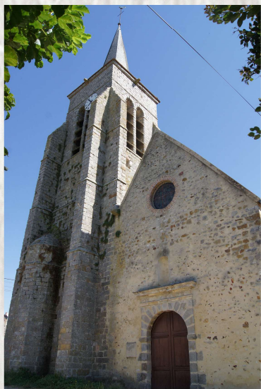
L'Église de Châtenay-sur-Seine

Le prieuré de La Chapelle : fondé au Moyen-âge par les moines bénédictins de l'abbaye de Ste Colombe les Sens. Il représente une seigneurie importante appelée La Chapelle Notre-Dame-sur-Seine, qui a droit de haute, moyenne et basse justice.