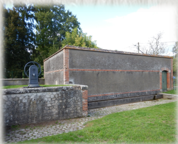
Des sources pour Paris

L'alimentation en eau de Paris se fait pour moitié par des eaux de sources captées loin de la capitale, en particulier en Seine-et-Marne. Ainsi, dans la basse vallée du Lunain, les sources de Villemer et de Villeron déversent leur eau dans un aqueduc qui les transporte jusqu'à l'usine de traitement de Sorques, à Montigny sur Loing. De là, elles sont renvoyées dans l'aqueduc du Loing qui va suivre celui de la Vanne jusqu'à Paris. Les eaux captées pouvant subir l'influence de toutes sortes d'activités humaines, de vastes périmètres de protection ont été instaurés dans la vallée, afin de réduire les risques de dégradation des sources.