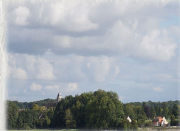
En basse vallée du Lunain

Un parcours à la découverte du Lunain, affluent du Loing, du plateau agricole et de sites d'anciennes industries.