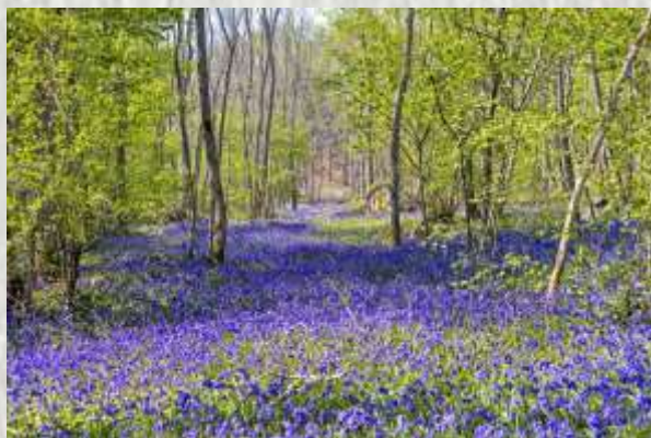
Jacinthes sauvages_ photo CM®

Le village de Crèveœur-en-Brie doit son origine à un petit fort de défense autour duquel quelques habitations s'étaient regroupées dès le Xème siècle. En 1175, le nom de Crepicordium (= crève-cœur : au moyen âge, nom d'une terre pénible à labourer car très lourde et difficile à drainer) est mentionné dans les rôles des fiefs du comté de Champagne et de Brie. La chapelle et le château-fort auraient été édifiés au début du XIIIème siècle sous l'égide de Hugues de Châtillon, seigneur de Crécy et de Crèveœur et vassal du comte de Champagne et de Brie, Thibault IV. Crèveœur connut son heure de gloire aux XIIIème et XIVème siècle, le château devenant résidence d'été des rois de France. Philippe VI de Valois y maria sa fille en 1332. Village et château furent ravagés par les Ligueurs au XVIème siècle. Le château actuel a été construit au centre village. Crèveœur a aussi été en septembre 1914, l'extrême avancée des troupes allemandes commandées par le général allemand Von Kluck, comme le mentionne l'inscription au dos du monument aux morts.