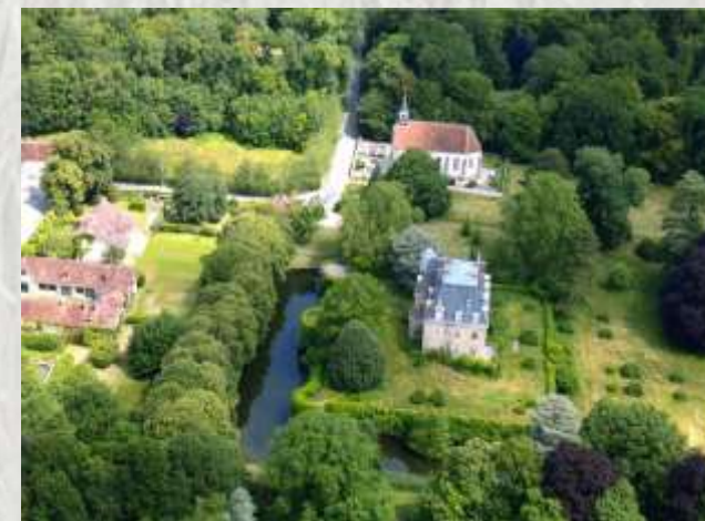
Crèveœur-en-Brie : village / église– Photos PB®